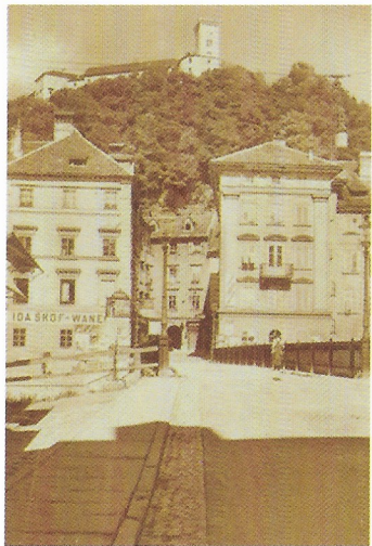
Ljubljana – Pod Trančo, razglednica, ok. 1920, 133 x 86 mm.

Ljubljana – svetovna prestolnica knjige 2010