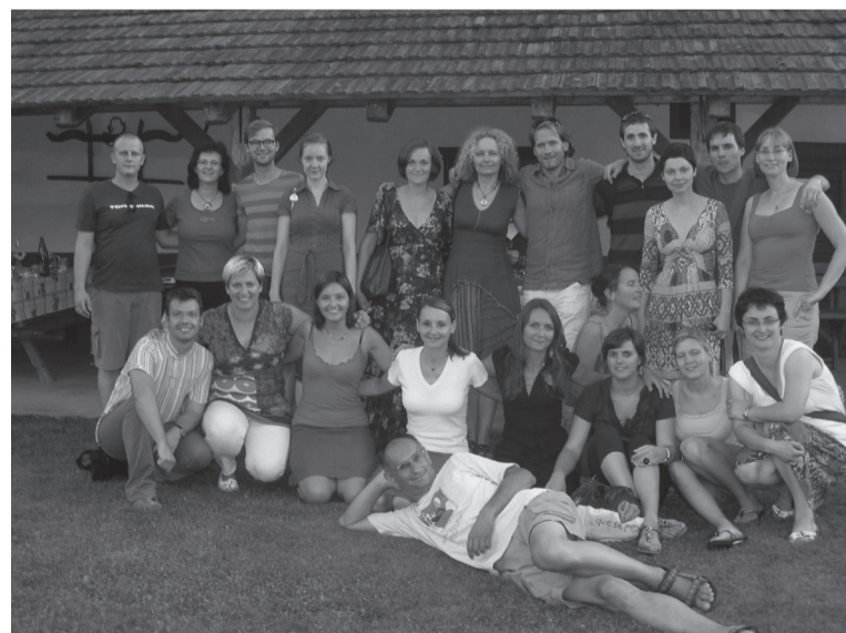
Učitelji slovenščine na tujih univerzah (izobraževanje v avgustu 2011)

Večina udeležencev mladinske poletne šole je bilo štipendistov Zavoda RS za šolstvo oz. Ministrstva RS za šolstvo in šport ter Urada RS Slovenije za Slovence v zamejstvu in po svetu.