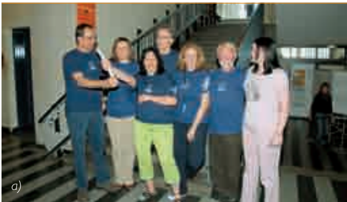
a) Ekipa zaposlenih na FF