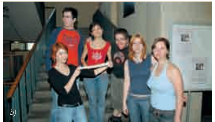
b) Ekipa študentov FF

Izžrebanega čaka nagrada v knjigah po lastni izbiri v Knjigarni FF, in sicer v vrednosti 100 EUR.